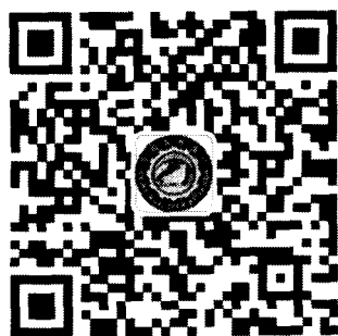
农业科技网络书屋微信 公众号