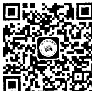
三农科学传播 公众号